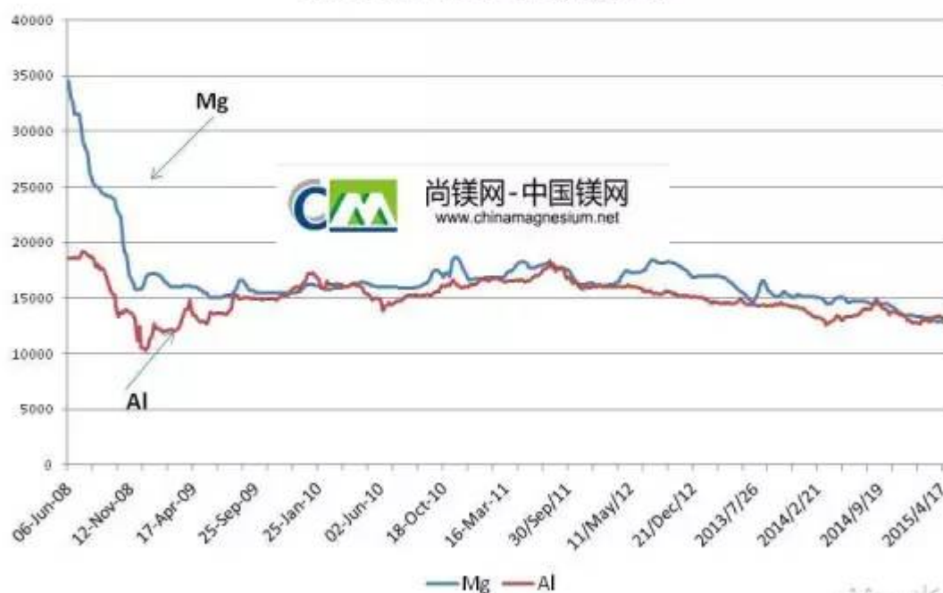
2008-2015 China Al & Mg Price