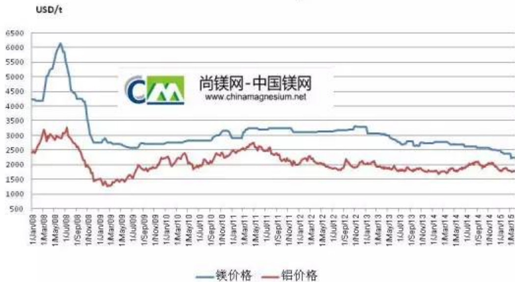
欧洲市场镁铝价格